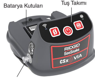
Verici Klipsli Terminal