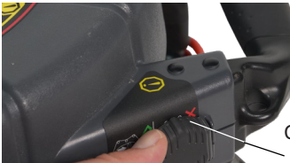
Chiusura della custodia