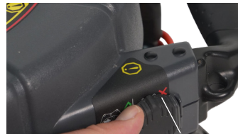
Verrou du boîtier