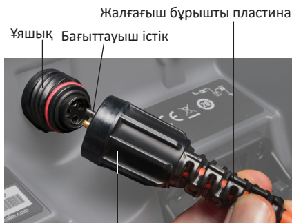
Сыртқы тоқтатқыш төлке

Тек сыртқы тоқтатқыш төлкені ғана бұраңыз. Қосқышты ешқашан майыстырмаңыз немесе бүкпеңіз.