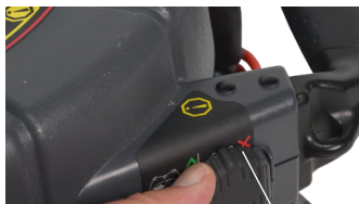
Západka na kryte