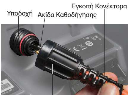
Εξωτερικό Περίβλημα Κλειδώματος

Περιστρέψτε μόνο το εξωτερικό ασφαλιστικό περίβλημα. Μη λυγίζετε και μη στρίβετε ποτέ τον κονέκτορα.