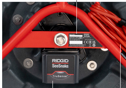
Μετρητής TruSense Καλώδιο Συστήματος SeeSnake