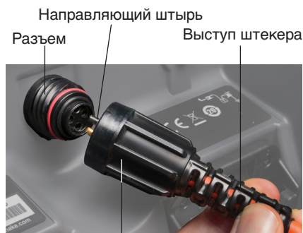
Внешняя стопорная втулка

Крутите только внешнюю стопорную втулку. Запрещено сгибать или скручивать контактный штекер.